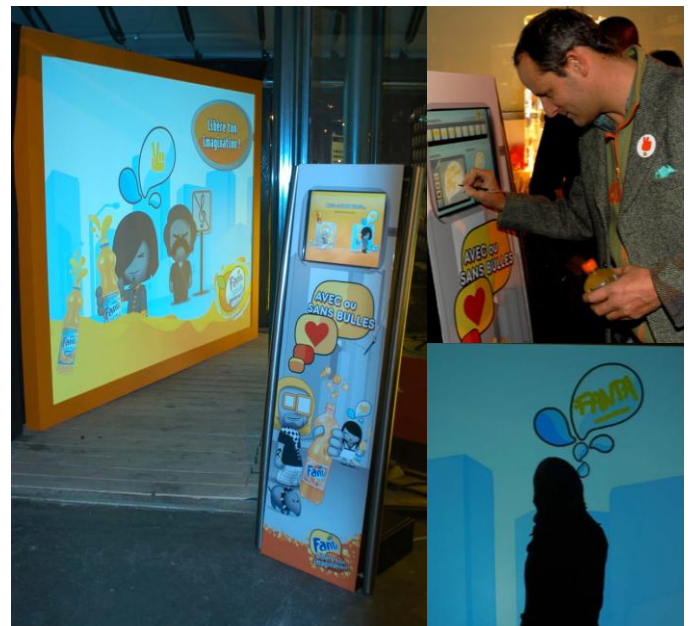
FANTA – Lancement de produits

Personnalisé à vos couleurs (création graphique de l'interface de la borne avec habillage et de l'animation murale), le « Mur des pensées » accompagnera votre évènement dans toute sa durée.