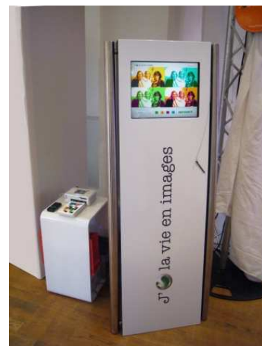
Sony Ericson - Conférence de presse