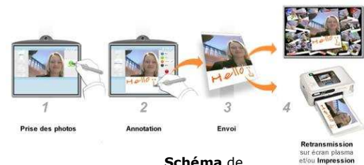
Schéma de Fonctionnement

Personnalisé à vos couleurs (adaptation graphique totale de l'interface de la borne), le Virtual « Photo Pinboard » accompagnera votre événement dans toute sa durée.