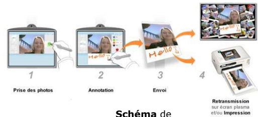
Schéma de Fonctionnement

Le participant se prend lui-même en photo grâce à la webcam intégrée à la borne. Il personnalise ensuite sa photo en ajoutant un texte ou un dessin avec un stylet sur l'écran tactile.