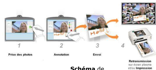
Schéma de Fonctionnement

Personnalisé à vos couleurs (adaptation graphique totale de l'interface de la borne), le Virtual « Photo Pinboard » accompagnera votre événement dans toute sa durée.