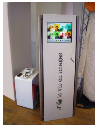
Sony Ericson - Conférence de presse