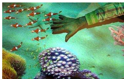
SHOWROOM – Animation ludique

Pour toute demande de devis personnalisé, contactez-nous par mail à info@moonda-event.com