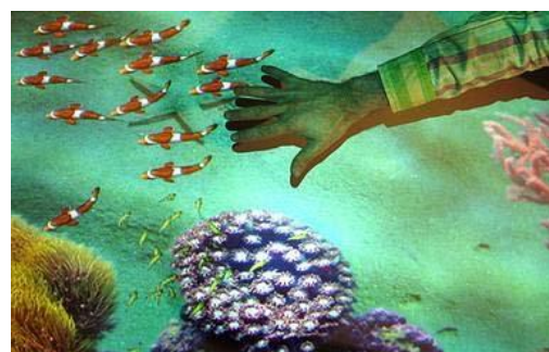
SHOWROOM – Animation ludique

Pour toute demande de devis personnalisé, contactez-nous par mail à info@moonda-event.com