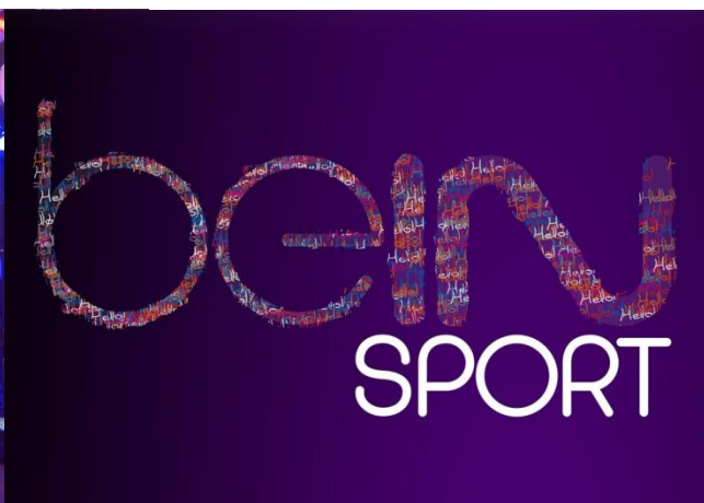
Interface de diffusion

Pour toute demande de devis personnalisé, contactez-nous à info@moonda-event.com